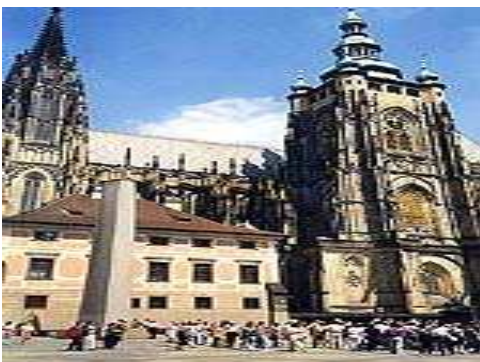
Cattedrale di San Vito ( Chrám Svateho Vítá )

L'area crea un panorama e un'atmosfera di Praga legati sempre alla oltre millenaria esistenza della città. Fondato dopo la metà del IX secolo divenne sede del casato reale dei Premyslidi. Il monumento culturale nazionale comprende tesori di architettura di molti stili architettonici, espressivi e artigianali e di relativi orientamenti.